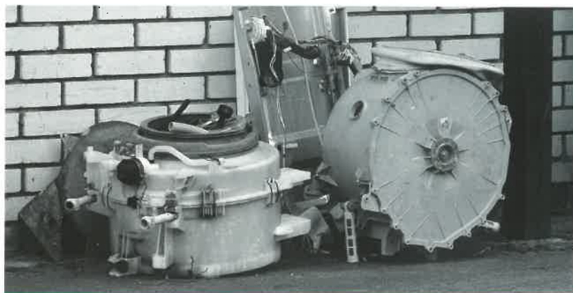
Velké spotřebiče (např. pračky či sporáky) jsou cenným zdrojem železa a hliníku

Množství (váha) elektroodpadu, který bude muset ten který kolektivní systém sebrat a zrecyklovat, vychází procentuálně z toho, kolik jeho účastníci (výrobci) prodali nových elektrozařízení (v tunách).